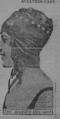
THE DIVER'S DELIGHT

While not narrow val, both lace and inserted, a strip of pink ribbon for a banding, and clusters of tiny rosebuds are the ingredients of this dainty lousier cap. The visor is slightly wired to keep its pliant line, and the back flap may be rolled up over curl papers if need be.