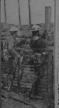
Canadian soldiers in the trenches are seen herewith wearing the new steel helmets which have been found to be a good protection against such varieties of shell fire. The Canadian regiments have recently taken part in some very heavy fighting.

WASHINGTON — News that conference between Generals Foch and Obereg has been closed without any agreement having been reached, has created a great impression on the Public.